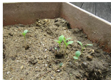
2週間後 発芽しました。