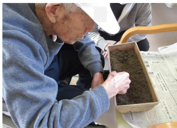
令和4年4月5日 種まき